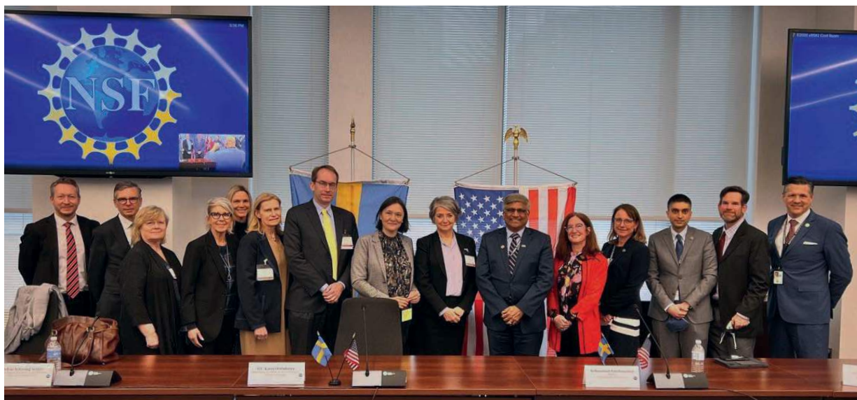
I mars 2022 träffade STINTs styrelse National Science Foundation i USA för att diskutera internationaliseringsfrågor. På mötet deltog även Sveriges ambassadör, innovations och forskningsrådet, samt STINTs verkställande direktör och representant i Nordamerika.

Styrelsen hade även möten med Sveriges ambassadör och Innovations- och forskningsrådet i Washington samt konsuln i San Francisco.