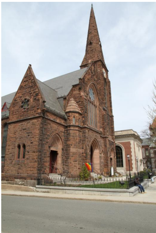
Northampton april 2011.

Eftersom mitt lektorat vid Göteborgs universitet i sociologi är inriktat mot genusfrågor och min forskning alltid berört frågor om klass- och genusidentitet föreföll placeringen vid Smith College och Northampton intressant och relevant. Smith är ett så kallat kvinnocollege med syfte stärka kvinnors röster och gemenskap och på så vis öka kvinnors framtida ledarpositioner (Smith College 2008). I såväl undervisning som i den bredare utbildningsmiljön är genusperspektivet och frågor om mångfald och social jämlikhet centrala ( www.smith.edu ). Northampton – den stad med ca 30 000 invånare där Smith College är beläget – är en politiskt progressiv stad där jämlikhets och jämställdhetsrörelser under senaste århundradet varit stark. Särskilt artikulera är frågan om sexuell jämlikhet och flera av Northampton invånare lever i homosexuella familjebildningskonstellationer. På flertalet av stadens kyrkor hänger regnbågsflaggan.