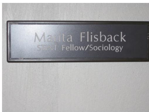
Skylten till mitt kontor vid Kahn Liberal Institute.

Jag anlände till Northampton och Smith College den 1 augusti, cirka en månad före terminsstart. På så vis gavs jag tid att ordna med praktiska detaljer som passerkort, tillgång till elektroniska studentplattformar och möte med biblioteksansvarig. Därtill kunde jag i lugn och ro kontakta och boka in ett antal möten med administrativa företrädare, lärare och forskare vid Smith College.